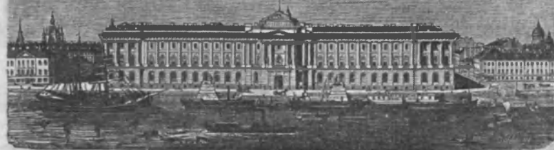
ИЛЛЮСТРАЦИЯ ВСЕМИРНОЕ ОБОЗРЕНИЕ