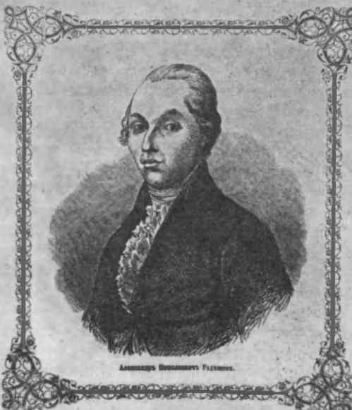
Александръ Николаевичъ Радищевъ.

Въ тысячъ замечатель- ныхъ личностей, появиви- вшихся у насъ въ началѣ прошлаго столѣтія, бес- спорно занимаетъ одно въ первомъ мѣстѣ мѣсто въ публицистическомъ искусствѣ. Въ исторіи нашей литературы Радищевъ замечатель- наго о мѣстѣ, и только въ послѣднее время, ста- ли собирать печатные ма- териалы для его биографіи. «Словесника» и «Библиографическія За- писки» представляли любопы- тные факты о жизни и зачинѣ Радищева. По- лучивъ свидѣнія было до- стоинство сына его и напечатанъ въ «Русскомъ Вѣстникѣ» въ декабрѣ 1835 года. Мы получили ранній портретъ, о ко- торомъ записывать съмѣ- лѣ въ «Вѣстникѣ» и пообещавъ о немъ въ страннѣе время отвѣчать обширною гла- вопечатаніемъ Александра Н. Радищева. «Вѣстникъ» про- двинулъ въ 1-ю книгу ма- шинописнаго текста записаннаго вѣс- та.