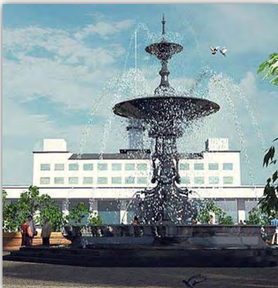
Фонтан благотворителей, площадь Маркина

Пособие состоит из трех разделов: в первом – исторический очерк о развитии благотворительности в Нижнем Новгороде, во втором – биографическая справка о некоторых известных купцах и династиях Нижнего Новгорода. Каждая персоналия снабжена QR-кодом. Наведите на него камеру смартфона - откроется ссылка на сайт в сети Интернет. В третьем разделе представлен список литературы по теме: статьи из сборников расположены в алфавитном порядке фамилий авторов сборников, публикации из периодической печати – в обратной хронологии. Указатель адресован учащимся 8-11 классов и предназначен в помощь изучению школьной программы и расширению кругозора. Пособие имеет вспомогательный аппарат – именной указатель, который содержит фамилии, часто упоминаемые в статьях. Пользоваться им просто: напротив каждой персоналии указан номер библиографической записи статьи из сборника или журнала, где упоминается фамилия. При составлении пособия использован электронный каталог ЦБС Канавинского района. На основе исторических миниатюр сотрудники библиотеки имени А. Грина предлагают вам ответить на вопросы онлайн-игры. QR-код расположен на последней странице пособия.