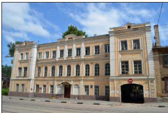
Здание первого детского приюта, улица Ильинская, дом 27