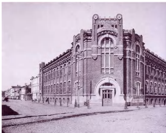
«Нижполигаф», улица Варварская, дом 32