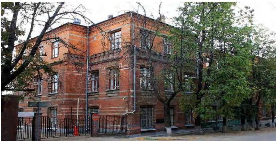
«Дом подкидышей», улица Семашко, дом 32