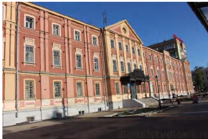
Вдовый дом, проспект Гагарина, дом 2