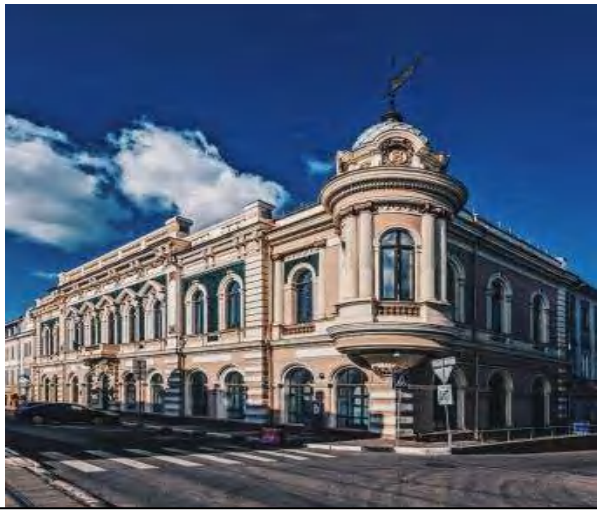
Здание доходного дома Бугрова улица Рождественская, дом 27

комната и небольшая приёмная — комната с выходом во двор, в которой висела люлька для подкидышей. Купцы-попечители в праздничные дни дарили вдовам и воспитанникам книги, одежду и билеты на утренники, а на Пасху - куличи и угощения. Знаменитый летчик Петр Нестеров после смерти отца жил с матерью во вдовьем доме. В 1918 году вдовый дом закрылся — после революции и смены власти содержать его было некому. Сейчас — общежитие Нижегородского государственного технического университета.