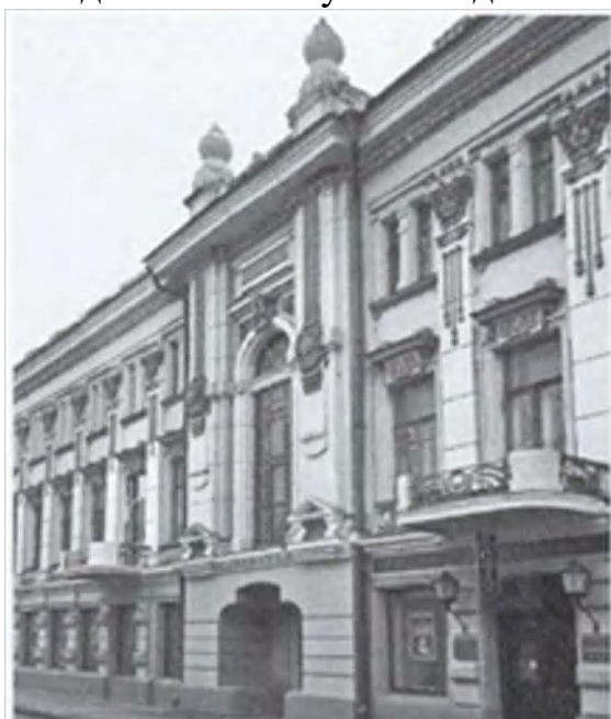
Дом Ф. Переплетчикова, улица Рождественская, дом 6

Нижегородские купцы были уверены, что богатые должны нести ответственность за бедных. Существовала традиция «подающих дней», во время которых они щедро одаривали не только нищих, но и любого человека, стоящего у ворот их дома. Особенным считался день закрытия ярмарки – 1 сентября. После молебна и крестного хода купцы возвращались в лавки и готовили милостыню. Среди выдающихся нижегородцев можно отметить купца второй гильдии Федора Переплетчикова. 2 В 1816 году он впервые был избран на должность главы Нижнего Новгорода и дважды переизбирался. За годы правления жизнь города изменилась к лучшему: налажена