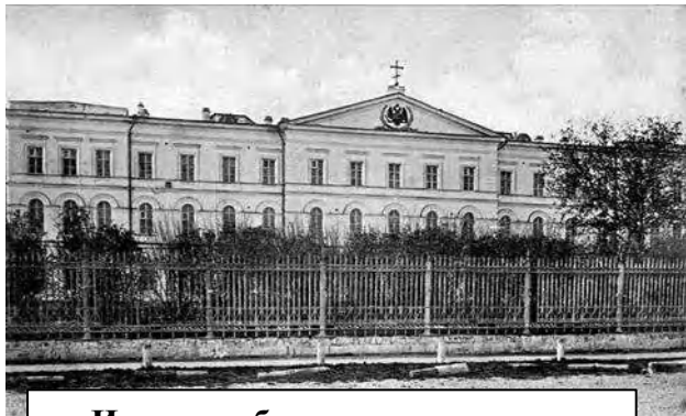
Институт благородных девиц, улица Минина, дом, 28-а

В 1852 году в Нижнем Новгороде был открыт Мариинский институт благородных девиц – первое женское учебное заведение закрытого типа для дочерей дворян, чиновников, священников и купцов. Сначала в институт приняли 25 воспитанниц. Девочки принимались в Институт в возрасте 10-12 лет, обучение длилось 6 лет. Воспитанницам преподавались Закон Божий, история, география, русская словесность, арифметика, естествознание, физика,