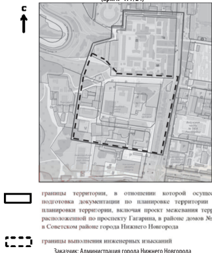
Схема границ подготовки документации по планировке территории (арх. № 177/24)

к приказу министерства градостроительной деятельности и развития агломераций Нижегородской области от 17.12.2024 г. № 06-01-02/64