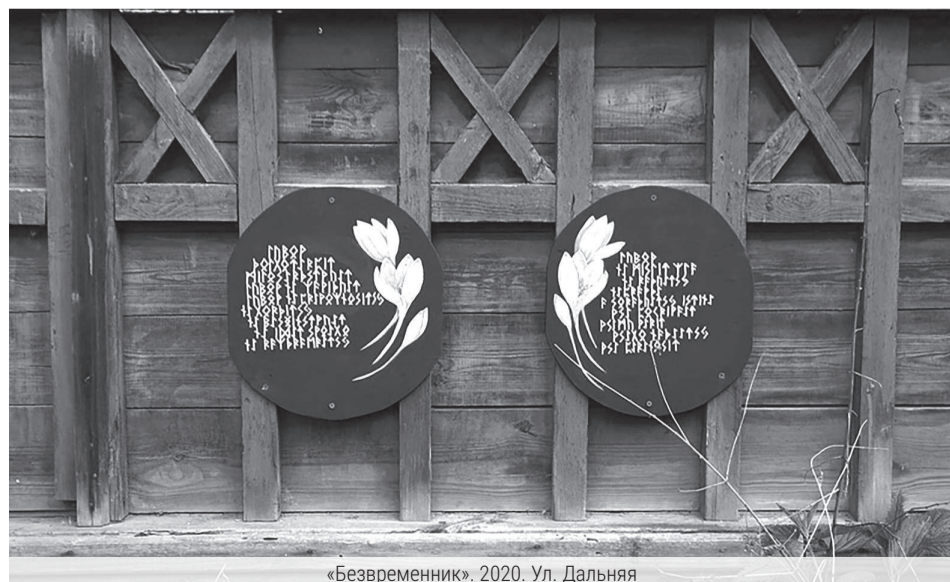
«Безвременник». 2020. Ул. Дальняя

(Окончание интервью в следующем номере.)