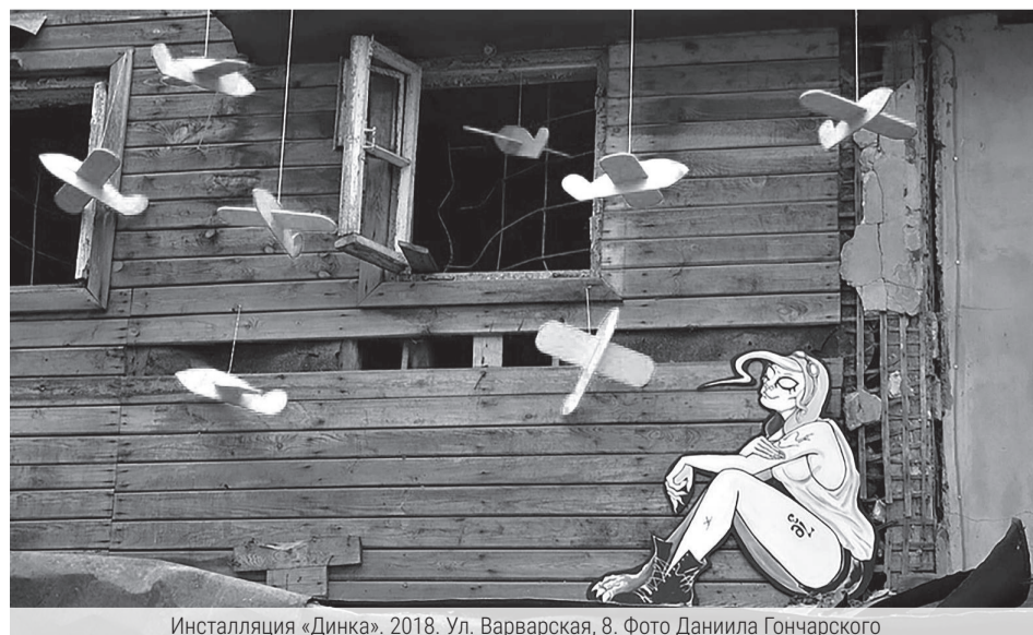
Инсталляция «Динка». 2018. Ул. Варварская, 8.