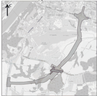
Схема границ подготовки документации по внесению изменений (арх. № 41/24)

Условные обозначения границы проекта планировки территории, расположенной от ул. Ларина до автомобильной дороги Р-158 в городском округе город Нижний Новгород и Кстовском муниципальном округе Нижегородской области, утвержденного приказом министерства градостроительной деятельности и развития агломераций Нижегородской области от 6 декабря 2023 г. № 06-01-03/51 границы подготовки документации по внесению изменений в проект планировки территории, расположенной от ул. Ларина до автомобильной дороги Р-158 в городском округе город Нижний Новгород и Кстовском муниципальном округе Нижегородской области Заказчик: ГКУ НО «ГУАД»