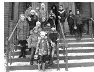
Марианна Егорова.