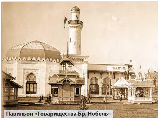
Павильон «Товарищества Бр. Нобель»

Всего в нефтяной империи БраНобель работало около 30 тысяч человек, следовательно, в ее орбиту вместе с членами семей рабочих и служащих входило не менее ста тысяч человек. Идея обновления жилой среды рабочих была реализована в нобелевских городках Уфы и Царицына, Астрахани и Саратова, Самары и Рыбинска. Братья Нобель в дореволюционной России стремились осуществить собственную социальную утопию, воплощая проект своего «Города солнца». И об этой многогранной деятельности рассказывала экспозиция павильона «Товарищества Бр. Нобель» на Всероссийской выставке в Нижнем Новгороде в 1896 году.