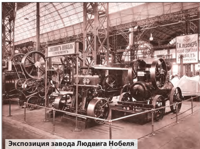
Экспозиция завода Людвиг Нобеля

6 мая 1882 года Людвиг Нобель заложил поселок и назвал его Villa Petrolea. Десяток зданий в византийском стиле, предназначенных для 100 служащих компании. Из каждого окна, обращенного на юг или на восток, видно море. Здесь клуб, комнаты отдыха, библиотека. А также театр, кегельбан, теннисные корты, велотрек. Благодаря чернозему, привезенному из плодородных земель Ленкорани, и пресной воде, доставляемой с Волги, здесь зацвели сады. Поселок стал подлинным оазисом среди тропической жары и окружающей Баку бесплодной полупустыни. Питьевой водой жителей обеспечивал опреснитель. С завода к домам был подведен газ для приготовления еды и отопления комнат. Освещение и на предприятии, и в поселке было электрическое, действовала телефонная линия. И, что совсем невероятно для XIX века, была сооружена установка для кондиционирования воздуха, которая позволяла поддерживать в летний период комфортную температуру в 15–20 градусов. Морем в конце весны доставлялось 800 тонн льда, которого хватало на весь летний сезон. «Здесь прекрасная оранжерея и велотрек, — сообщала 13 января 1901 года газета «Каспий». — Дома заводских служащих и клуб утопают в зелени. Народные чтения, концерты,