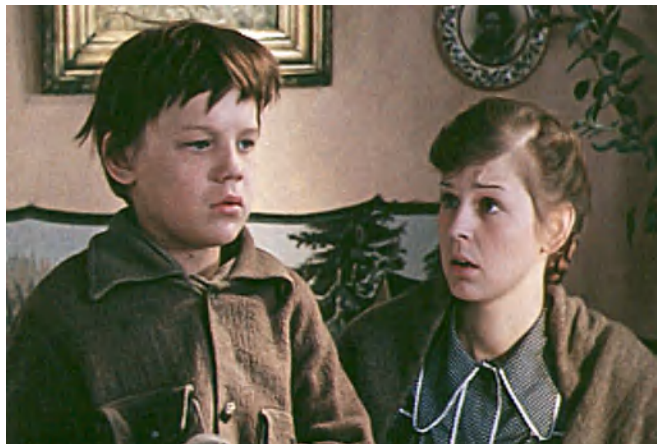
Кадр из фильма «Уроки французского» (1978)

Если говорить о самом известном произведении В.Г. Распутина, то за этот титул могут поспорить рассказ «Уроки французского» и повесть «Прощание с Матёрой».