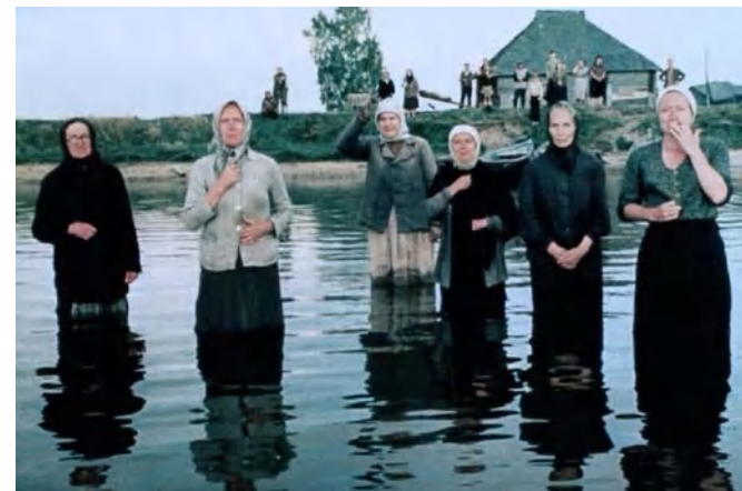
Кадр из фильма «Прощание» (1981)