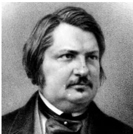
Оноре де Бальзак (1799-1850)

О последней книге он писал: «О, это книга великая, не такая, какие теперь пишут; такие книги посылаются человечеству по одной в несколько сот лет. (...) Эту самую грустную из книг не забудет взять с собою человек на последний Суд Божий. Он укажет на сообщенную в ней глубочайшую и роковую тайну человека и человечества» (Дневник писателя, 1877 г.).