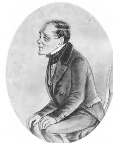
Макар Девушкин («Бедные люди») — прямой наследник гоголевского «маленького человека».

Исследователи считают, что Достоевский — первый русский автор, который «вышел из шинели Гоголя». «Новым Гоголем» назвал молодого писателя и Николай Некрасов .