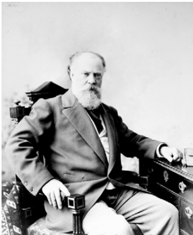
К.Е. Маковский. 90-е годы.

Картина Константина Егоровича Маковского «Воззвание Минина», законченная в 1896 году, — одно из крупных исторических полотен широкого эпического звучания. Оно посвящено выдающемуся событию в истории Нижнего Новгорода и всей страны — созданию Нижегородского ополчения, спасшего в 1612 году Москву и всю Русь от иноземных захватчиков.