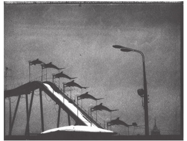
Выставка будет работать до 12 июня ежедневно с 12 до 20 часов. Понедельник – выходной. Каждую среду вход на выставку свободный.

Сара Мун говорит, что фотографом ее сделали фильмы: «Если копаться совсем глубоко, то первооткрывателем силы визуального образа для меня был Сергей Эйзенштейн. Его фильмы, работы настоящего мастера, дали мне очень много задолго до того, как я открыла для себя фотографию».