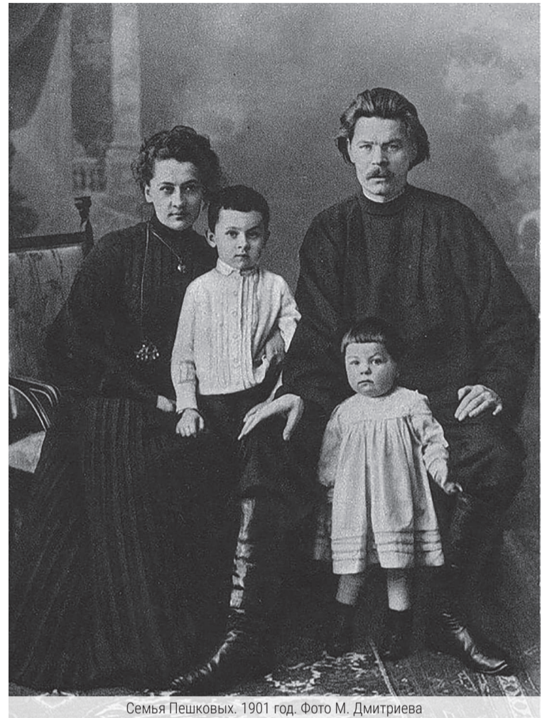
Семья Пешковых. 1901 год.

1930-е годы в СССР – время доносов, арестов, расстрелов, отречения от отцов – врагов