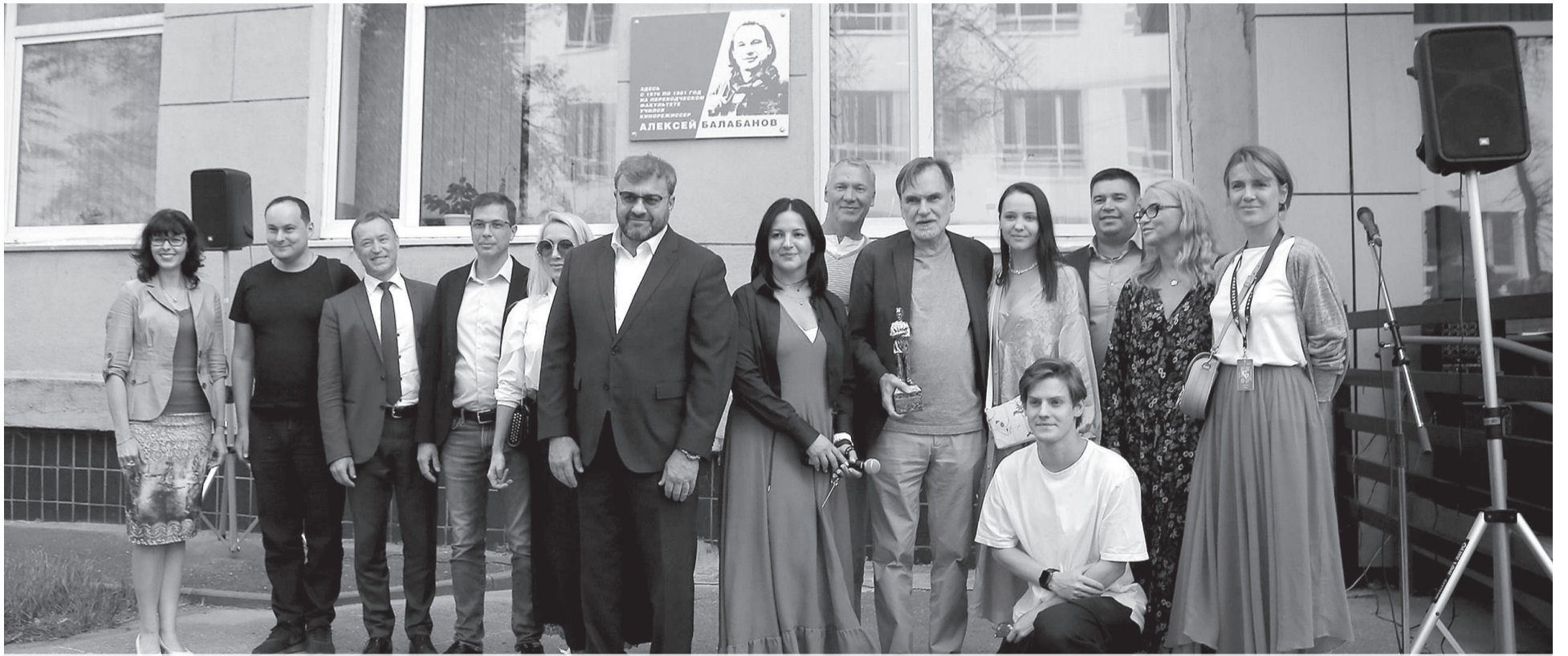
В Нижегородском государственном лингвистическом университете (НГЛУ) им. Н. А. Добролюбова открыли мемориал, посвященный российскому режиссеру, выпускнику Горьковского иняза 1981 года Алексею Балабанову.